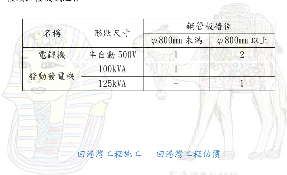
回港灣工程施工 回港灣工程估價