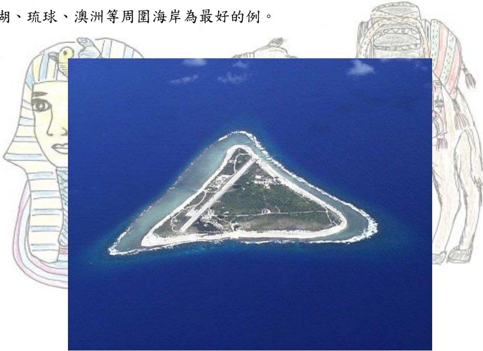
2011 埃及邊礁羅河之旅

熱帶的淺海，珊瑚礁蟲的遺骸堆積形成，共有邊礁、環礁及堡礁等3種形式，澎湖、琉球、澳洲等周圍海岸為最好的例。