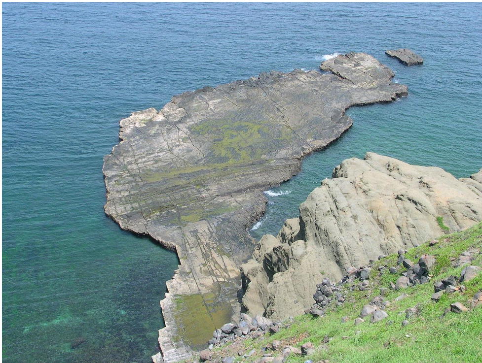
台灣澎湖的海蝕平台「小臺灣」