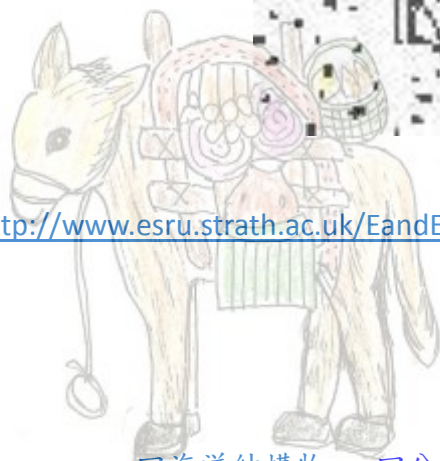
回海洋結構物 回分類索引 載滿貨品的驢子