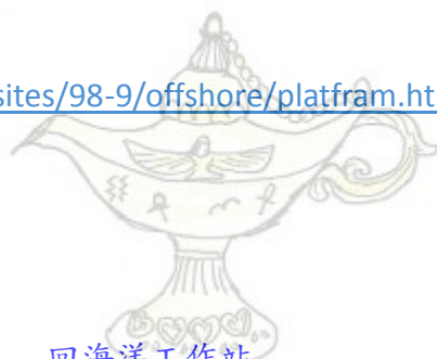
回海洋工作站 阿拉丁神燈