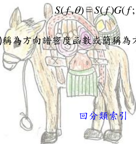
載滿貨品的 馬廩子

S(f, \theta) 稱為方向譜密度函數或簡稱為方向譜， G(f; \theta) 稱為 方向分佈函數 或方向函數。